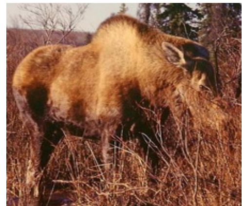
Diese erboste Elchkuh hätte zum Schutze ihres Neugeborenen um ein Haar unser Kanu attackiert

Eine willkommene Abwechslung war auch der Abstecher an ein verlassenes Ferienreiseort mit heissen Quellen, denn der Frühling machte sich nur zögerlich bemerkbar und nach dem anhaltend feuchtkaltem Wetter genossen wir das Bad im heissen Wasser umso mehr.