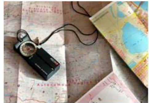
Kartenstudium ist ein wichtiger Teil der Vorbereitung

Für die Planung meiner Veloreise habe ich, nachdem die Route einmal ungefähr feststand, versucht herauszufinden zu welcher Jahreszeit ich am Besten in den Ländern mit den extremsten klimatischen Bedingungen unterwegs sein sollte. So habe ich darauf geachtet, möglichst nicht während der Monsunzeit in Südostasien zu sein oder eine Überquerung von grösseren Gebirgszügen im Winter zu vermeiden. Daraus abgeleitet habe ich einen ungefähren Zeitplan und somit schliesslich das Datum für den Start der Reise festgelegt. Natürlich geht es schlussendlich nie ganz auf und so lässt es sich bei meiner Tour beispielsweise nicht vermeiden, dass ich im Winter in Mitteleuropa starten und später dann im Hochsommer durch die Wüstengebiete Zentralasiens fahren werde.