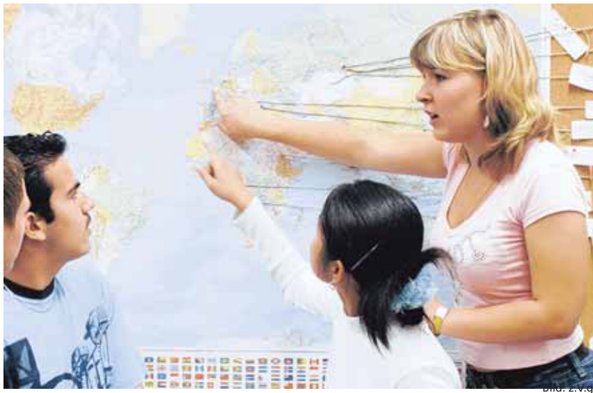
Flexibles Besoldungssystem für Volksschullehrer wird geprüft.